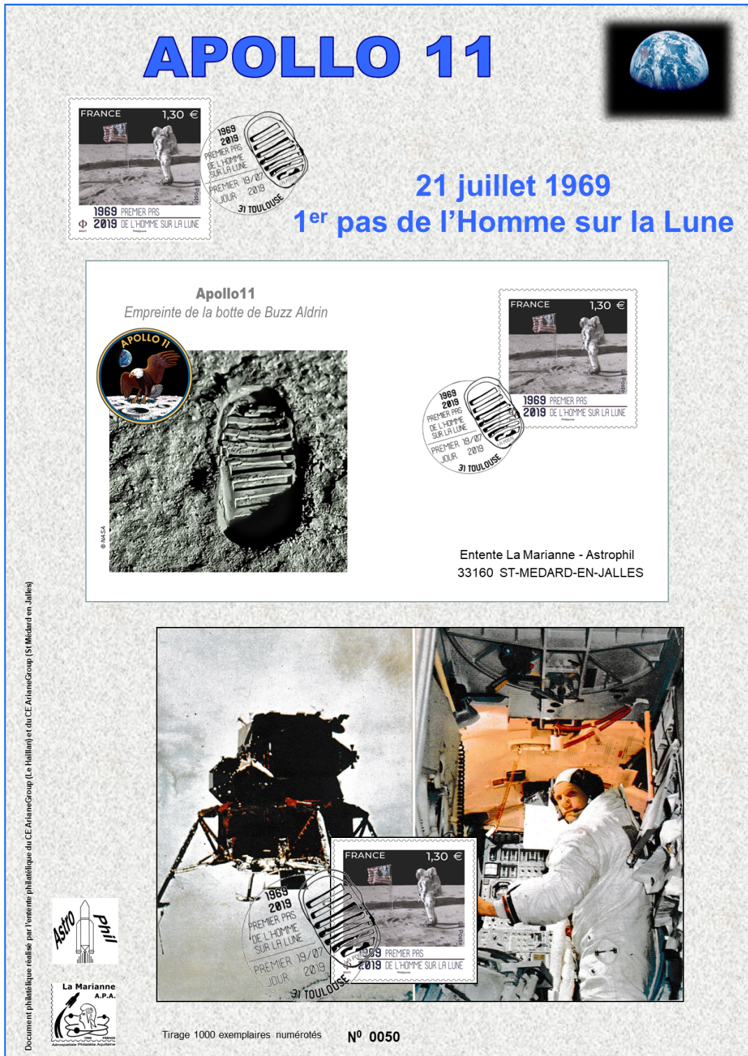
Encart (format A4)