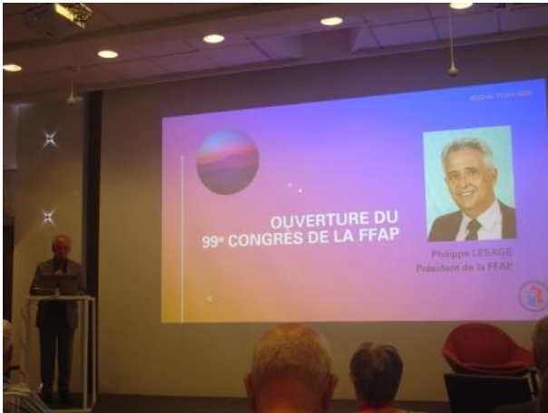
Le Président fédéral ouvre l'assemblée générale