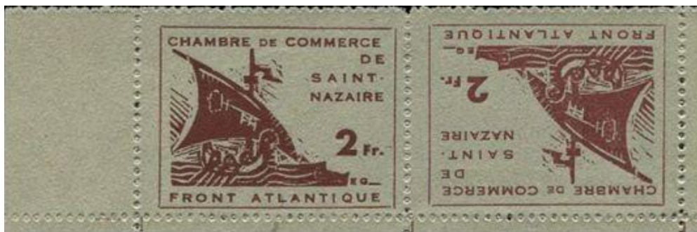
Timbre de guerre n°75a en paire horizontale tête-bêche.